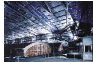
Le Fresnoy, Bernard Tschumi, Tourcoing - Γαλλία, 1991-1997