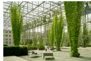
Πάρκο MFO, Burckhardt + Partner - Raderschallpartner, Ζυρίχη - Ελβετία, 2002

En Route Architects - Κατερίνα Κούρκουλα, Hannes Gutberlet