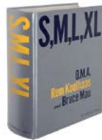
'S,M,L,XL', OMA - Rem Koolhaas - Bruce Mau, The Monacelli Press, 1995