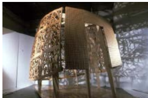
Περίπτερο Philibert de l'Orme, Bernard Cache, Παρίσι - Γαλλία, 2001