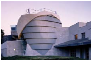
New City, Eric Owen Moss Architects, Καλιφόρνια - ΗΠΑ, 1988-