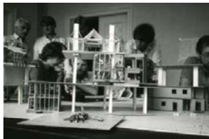
Ökohaus Corneliusstrasse IBA, Frei Otto, Βερολίνο - Γερμανία, 1987