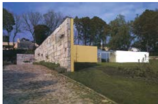
Κατοικία Λεωφόρου Βοαβιστα, Eduardo Souto de Moura, Πόρτο - Πορτογαλία, 1987-1994