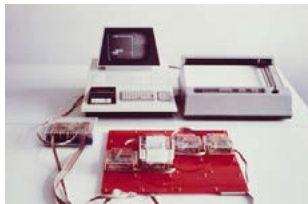
The Generator, Cedric Price, Gilman Paper Corporation - White Oak - ΗΠΑ, 1976-1980