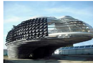
Villa Nurbs, CLOUD9 - Enric Ruiz Geli, Empuriabrava - Ισπανία, 2002