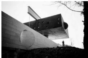
Κατοικία Bordeaux, OMA - Rem Koolhaas, Bordeaux - Γαλλία, 1998