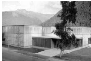
Μουσείο Kirchner, Gigon / Guyer, Νταβός - Ελβετία, 1992