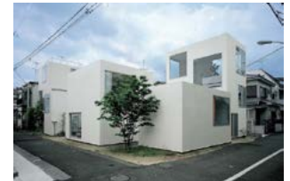
Κατοικία Morioka, Ryue Nishizawa, Τόκιο - Ιαπωνία, 2002-2005