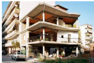
Το Dom-ino του Γιώργου και της Πολυξένης, Καρδίτσα - Ελλάδα