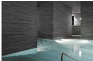
Λουτρά Therme Vals, Peter Zumthor, Vals - Ελβετία, 1994-1996